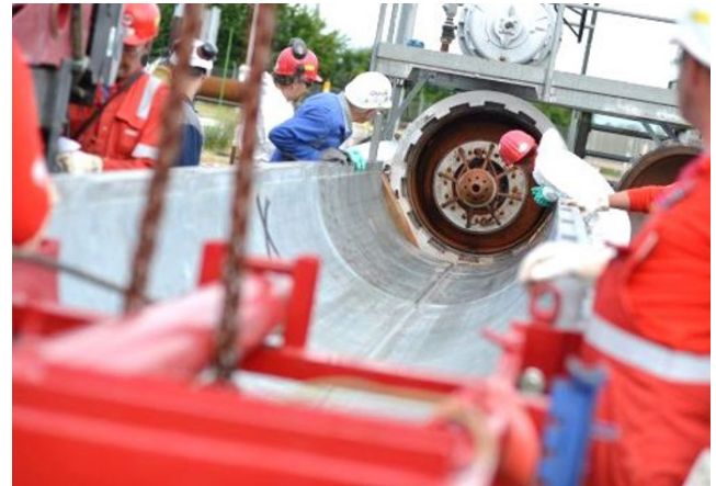
Molcheinbau und -ausbau erfordern besondere Aufmerksamkeit

Sehr gerne erstellen wir Ihnen ein individuelles Angebot, detailliert abgestimmt auf Ihre Anforderungen – wir freuen uns auf Ihre Anfrage!