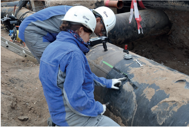
Coating Inspektoren im Einsatz